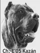
Ch. E'05 Kazán

Cría y selección del Dogo Canario y Gos d'Atura Català